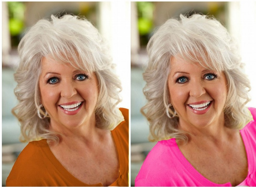
Warm & Muted Not so great