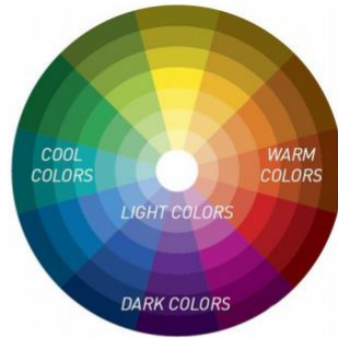
Cool + Clear Great!

Mettiti davanti allo specchio, senza trucco, col viso ben illuminato dalla luce naturale.