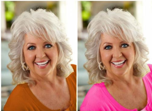
Warm & Muted Not so great